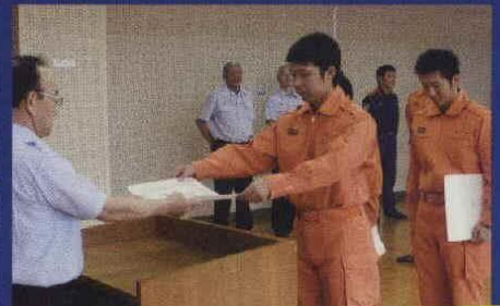
6/25 消防本部講堂において谷中消防長より表彰状の伝達