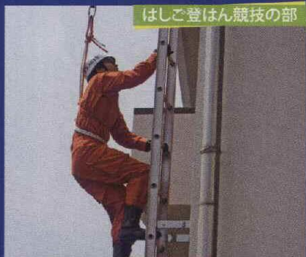
はしご登はん競技の部