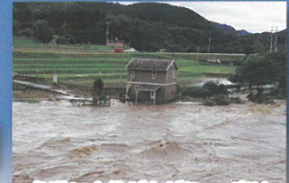
急激に水位が上がり、一度は家屋が水に飲み込まれました