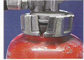
ふたが破損している消火器

消火器の破裂による事故が全国では毎年のように起きています。へこみ、変形、さびが発生しているような消火器を使用したら、容器内に急激な圧力がかかり破裂してしまいます。腐食のひどいものに関しては動かただけで破裂してしまうといった事例もあります。