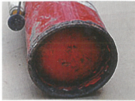
黒く変色している消火器