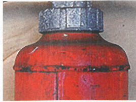
底の塗装がはがれた消火器