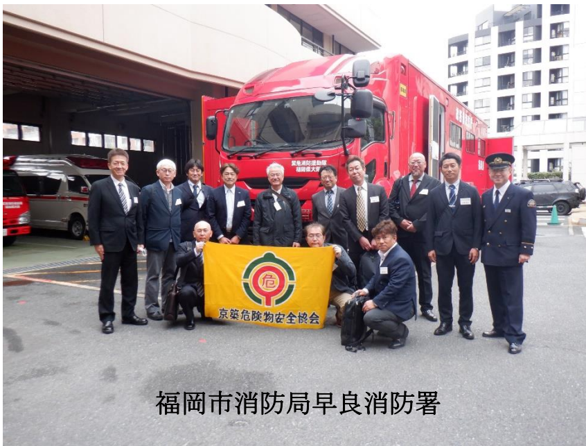
福岡市消防局早良消防署