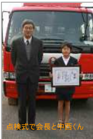
点検式で会長と中西くん

消防長等による審査会で、入選10点、優秀1点を選びました。優秀作品の右に掲載のポスターを、管内の学校、店舗、事業所などに掲出していただき、火災予防を呼びかけます。