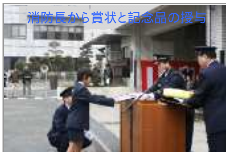
消防長から賞状と記念品の授与

平成20年消防点検式(1月7日)において、消防長から賞状と記念品が贈られました。また、会場に来ていた新聞記者から取材を受け、戸惑いながらもハッキリと質問に答えていました。